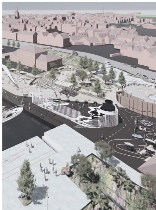
Der er afsat kommunale midler i 2025-26 til en ny Geobannepark mellem Jessens Mole og Nordre Kaj.

Endelig vil Kommuneplanen, der formelt fastlægger rammerne for anvendelse af områderne, herunder rækkefølge for boligudbygning, blive revideres hvert 4. år.